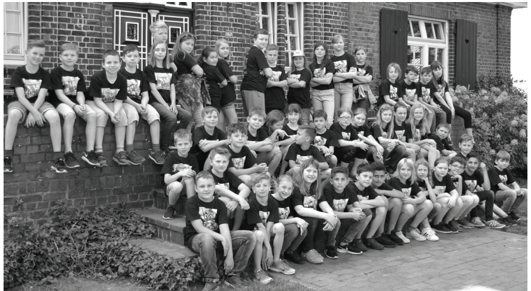
Auf einen Blick: Alle Viertklässler vor unserer schönen Unterkunft, der Jugendherberge in Otterndorf

Alle Kinder wussten, dass es eine Zimmer-Olympiade gab. Dafür mussten die Zimmer aufgeräumt sein, das Bett musste gemacht sein, der Schrank sollte ordentlich sein und man sollte die Nachtruhe um 22.00 Uhr einhalten. So bekam man nämlich Punkte. Nach dem Essen vergnügten wir uns mit verschiedenen Spiele, zum Beispiel Twister oder Eiermatsch (das haben wir in der letzten Zeitung erklärt). Dann ging es ins Bett.