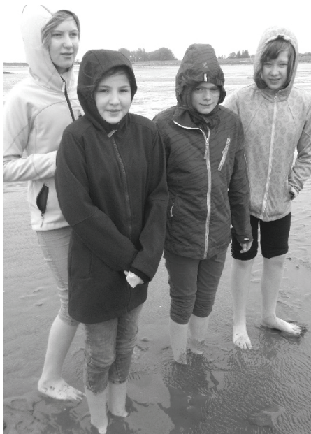
Ganz schön kalt im Watt!

Die Fahrt dauerte 4 Stunden. Als wir endlich angekommen waren, aßen wir erstmal Mittagessen. Dann wurden die Zimmer verteilt und wir richteten uns dort ein. Anschließend gingen wir an den nahen Strand. Dort war allerdings gerade Ebbe. Also spielten wir im Watt. Als wir wieder in der Jugendherberge waren, duschten sich manche. Essen gab es nach dem Duschen.