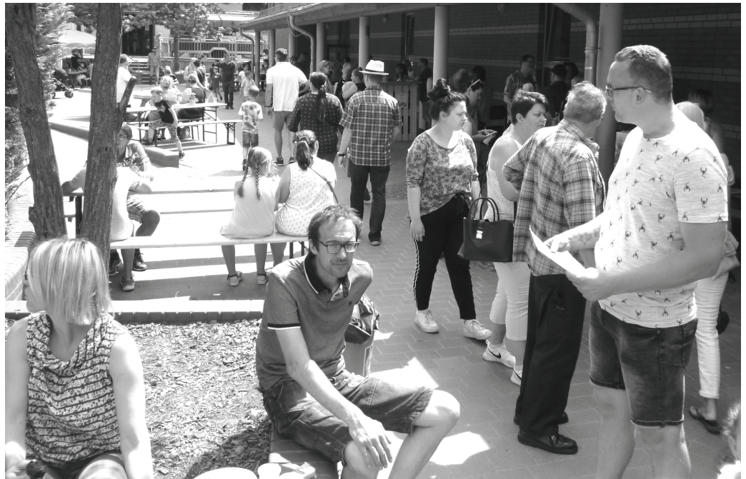
Am Samstag gab es viel zu gucken! Viele Besucher kamen, es herrschte eine entspannte Stimmung.

Bei Kunst denkt ihr bestimmt gleich an Malerei. Andere Techniken wie Schneiden, Kleben, Drucken, Basteln, Töpfern und Flechten gehören aber auch dazu. Insgesamt 17 Projekte standen für uns zur Auswahl. Davon konnten wir vorher drei aussuchen, für jeden Tag eins. Angeboten wurden sie von unseren Lehrerinnen und Lehrern, vom Offenen Ganztage und auch von einigen Eltern.