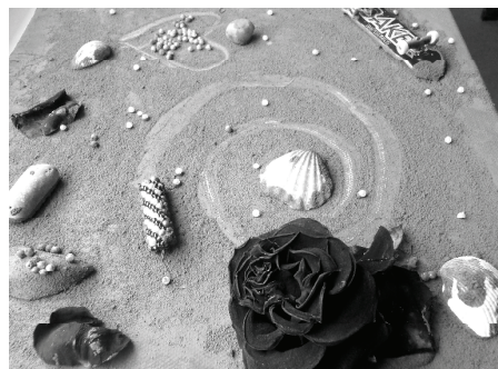
Kunstwerk eines Mädchens aus unserer Redaktion – hier leider nur in schwarz-weiß!

In den ersten beiden Stunden war die 4b dran. Dann hatte unsere 4a zwei Stunden Zeit, um mit der Künstlerin im Container zu arbeiten. Jeder suchte sich seine Materialien zusammen wie zum Beispiel Muscheln, Steine, Blumen, Fotos und anderen kleinen Sachen.