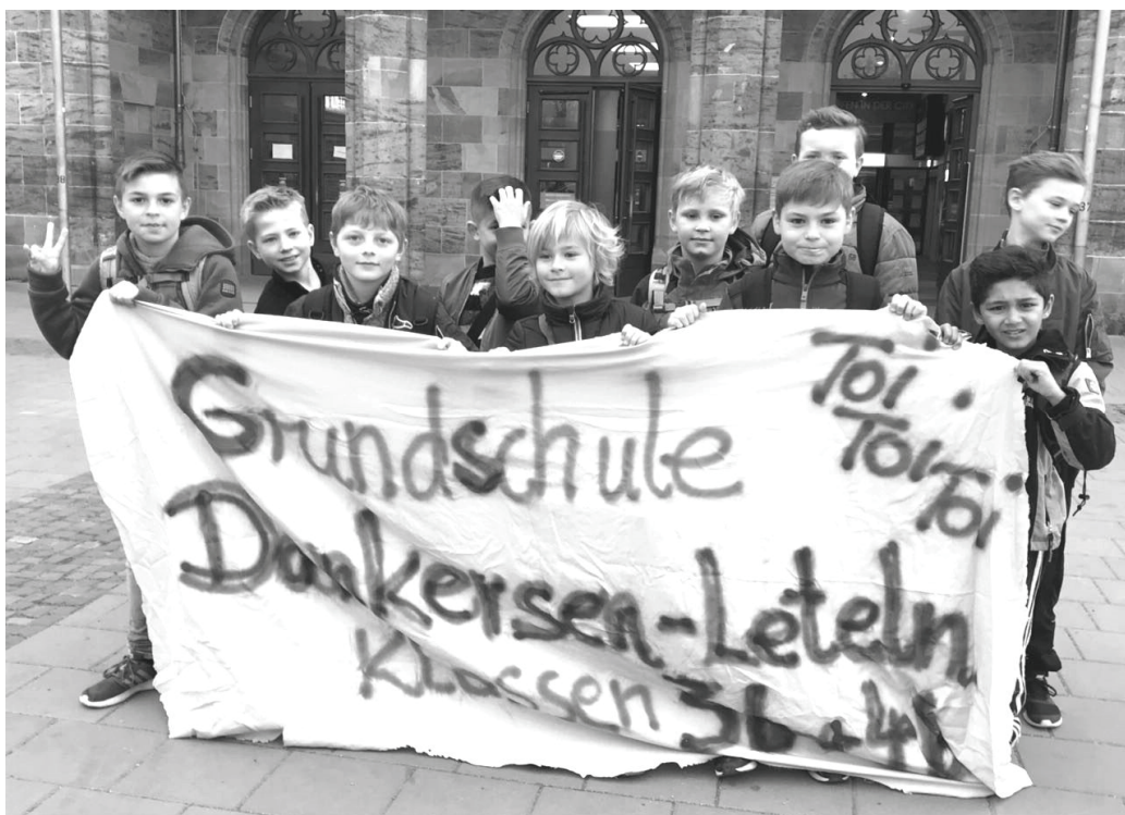
Unsere Spieler mit Unterstützer-Transparent, morgens vor der Abfahrt auf dem Bahnhof