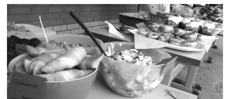
Eltern stifteten ein großes Buffet

Die Sonne lockte auch viele Besucher nach draußen. Sie nutzten die Gelegenheit, um bei Kaffee und Kuchen einen kleinen Klönschnack zu halten. Unser Förderverein hatte eine Cocktail- und eine Kaffeebar aufgestellt, auch Pizza- und Eiswagen waren da. Viele Eltern hatten Speisen gesponsert für ein großes internationales Buffet, und so herrschte auf dem Schulhof eine sehr entspannte Stimmung.