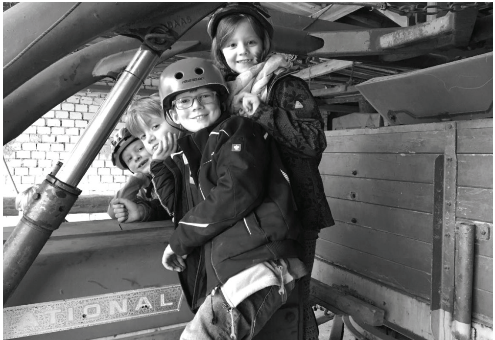
Endlich mal auf einem richtigen Trecker!

Die Osterferienbetreuung vom 3. – 6. April lief unter dem Motto „Naturerlebnis Bauernhof“. Das Thema ist interessant und wichtig. Das meiste, was wir essen und trinken, kommt schließlich vom Bauernhof: Obst, Gemüse, Getreide, Fleisch, Eier, Milch - da will man ja auch mal wissen, wie es dort eigentlich aussieht! Am Dienstag formten wir zunächst aus Salzteig verschiedene Tiere, die es auf dem Bauernhof gibt. Am Mittwoch war es dann soweit: Wir besuchten eine Bauernhof! Viele von uns hatten extra Inliner und Roller mitgebracht. Damit ging es dann