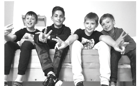
Alles bestens aufgeräumt!

aufgesetzt. Manchmal ist man bis zu den Knien eingesunken, dann waren wenigstens die Füße warm. Danach sind alle duschen gegangen, lange und warm. Anschließend unternahmen wir einen Ausflug in die „Spaß- und Spielscheune“, wo es jede Menge tolle Spielmöglichkeiten gab. Nach dem Abendessen war es dann soweit: Die Preisverteilung für die Zimmer-Olympiade! Wer die meisten Punkte geholt hatte, durfte sich die besten Preise aussuchen – zum Beispiel Einhorn-Gläser und Kuscheltiere. Danach machten wir eine Party, mit Tanzfläche und Buffet. Dann gingen wir schlafen.